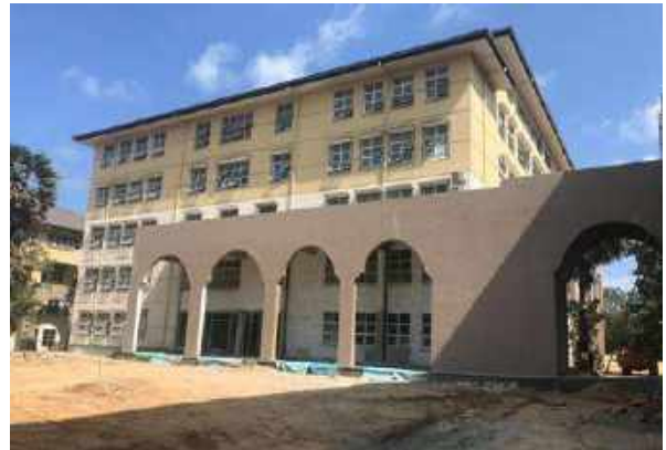
සායනික විද්‍යා දෙපාර්තමේන්තුව සහ අතිරේක සෞඛ්‍ය විද්‍යා දෙපාර්තමේන්තුව