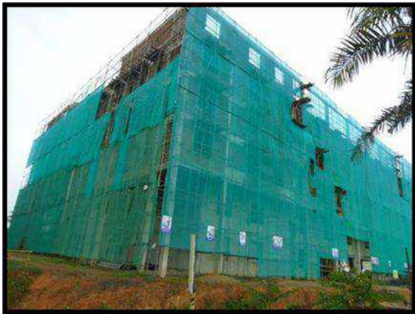
රුහුණ විශ්වවිද්‍යාලයේ වෛද්‍ය පීඨය සඳහා මහල් දොලහක ගොඩනැගිල්ලක් ඉදි කිරීමේ ව්‍යාපෘතිය