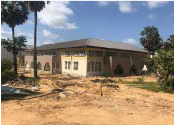
පුස්තකාලය සහ ස්වයං ඉගෙනුම් පහසුකම්

2022 වර්ෂය අවසන් වන විට ඉදිකිරීම් කටයුතු අවසන් කර ඇති අතර ගොඩනැගිලිවල රූප සටහන් කිහිපයක් පහත දක්වා ඇත.