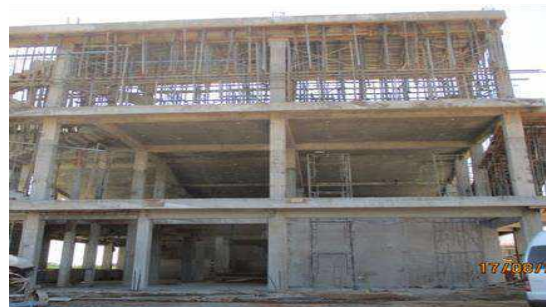
ATI මධ්‍යස්ථානය, මන්නාරම ඇ.පි. රු.මි. 529