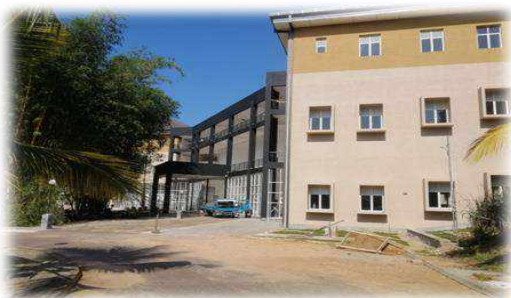
තාක්ෂණ පීඨය සඳහා තෙමහල් දේශන ශාලා ගොඩනැගිලිල්ල, රුහුණ වි. ඇ.පි. රු.මි. 412

උසස් අධ්‍යාපනය පුළුල් කිරීම සහ සංවර්ධනය කඩිනම් කිරීමේ ව්‍යාපෘතිය යටතේ ක්‍රියාත්මක වන ඉදිකිරීම් ව්‍යාපෘතීන්හි රූප සටහන්