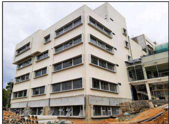
පර්යේෂණ ගොඩනැගිල්ල - සබරගමුව වි.වි.