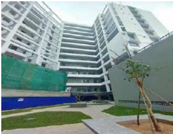
විද්‍යාගාර ගොඩනැගිල්ල - තාක්ෂණ පීඨය, කැලණිය වි.වි.

මෙම ව්‍යාපෘතිය යටතේ තෝරාගත් පර්යේෂණ ව්‍යාපෘති යෝජනා 22ක් සඳහා අරමුදල් ලබා දී ඇති අතර ඒවා දැන් විශ්වවිද්‍යාල මට්ටමින් ක්‍රියාත්මක වෙමින් පවතී.