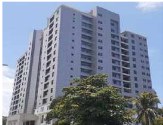
පූර්ව සායනික ගොඩනැගිලි සංකීර්ණය ඉදිකිරීමේ ව්‍යාපෘතිය, කොළඹ විශ්වවිද්‍යාලය

උසස් අධ්‍යාපන අංශයේ දේශීය ණය යටතේ ක්‍රියාත්මක වන විශාලතම ව්‍යාපෘතිය මෙය වේ. මේවන විට මෙහි ඉදිකිරීම් කටයුතු අවසන් කර ඇති අතර අඩුපාඩු සැකසීමේ කටයුතු තවදුරටත් සිදුවෙමින් පවතී. 2022.06.08 ව්‍යාපෘතිය භාර ගන්නා ලද දිනය ලෙස උපදේශන සමාගම අදාළ සහතිකය (Taking over Certificate) නිකුත් කර ඇත. කොන්ත්‍රාත්කරු විසින් අවසාන බිල් පත්‍රය ද උපදේශන සමාගම වෙත භාරදී ඇත. මේ දක්වා කොන්ත්‍රාත්කරුට රු.5,346,658,175.00 (වැට් සමඟ) ක් ද උපදේශන සමාගමට රු.198,124,312.91 ක් ද ව්‍යාපෘතිය වෙනුවෙන් සිදුකල අනෙකුත් ගෙවීම් වශයෙන් රු.100,984,769.33 ක් ද වශයෙන් රුපියල් 5,645,767,257.24ක මුදලක් ගෙවා ඇත.