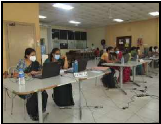
6වන ශිෂ්‍ය කණ්ඩායම තෝරා ගැනීම සඳහා මාර්ගගත සම්මුඛ පරීක්ෂණ පැවැත්වීම.