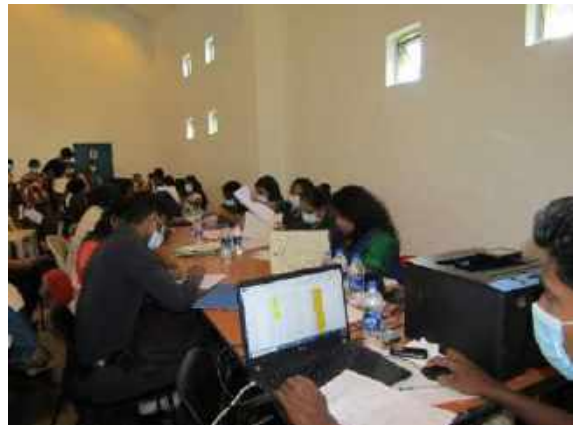
රාජ්‍ය නොවන උසස් අධ්‍යාපන ආයතනවල 6වන බඳවා ගැනීම් සඳහා ලියාපදිංචිය පැවැත්වීම.