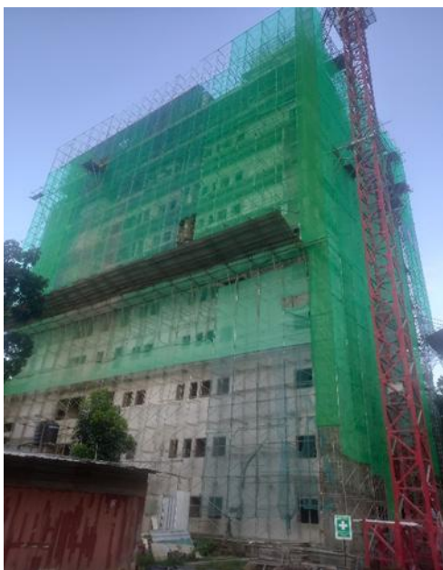
රුහුණ විශ්වවිද්‍යාලයේ වෛද්‍ය පීඨය සඳහා මහල් දොළහක ගොඩනැගිල්ලක් ඉදි කිරීමේ ව්‍යාපෘතිය (උසස් අධ්‍යාපන අංශය)

රුහුණ විශ්වවිද්‍යාලයේ වෛද්‍ය පීඨය සඳහා මහල් දොළහක ගොඩනැගිල්ලක් ඉදිකිරීමේ ව්‍යාපෘතියේ හා මහාචාර්ය ඒකකයක් ගොඩනැගිල්ලක් ඉදිකිරීමේ ව්‍යාපෘතියේ ඡායාරූප සටහන් පහත දක්වා ඇත.