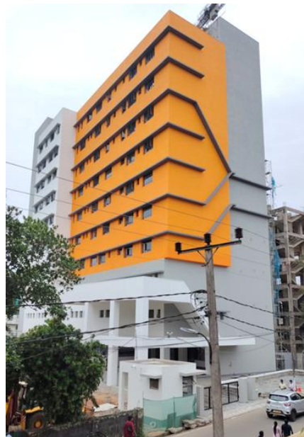
රුහුණ විශ්වවිද්‍යාලයේ සම සෞඛ්‍ය විද්‍යා පීඨය ඉදි කිරීමේ ව්‍යාපෘතිය