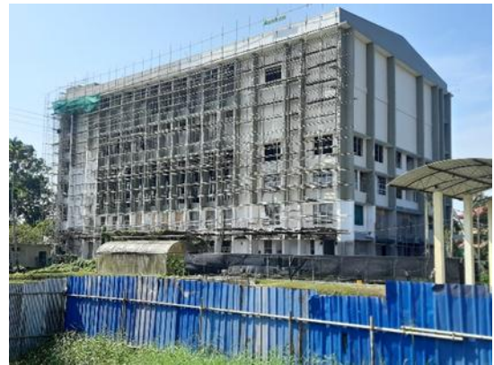
ගනු කාර්ය මධ්‍යස්ථානය, වයඹ විශ්වවිද්‍යාලය - මාකඳුර පරිශ්‍රය