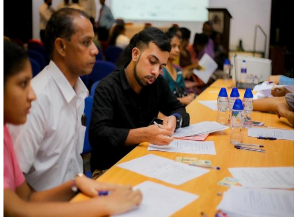
7වන බඳවා ගැනීම සඳහා රාජ්‍ය නොවන උසස් අධ්‍යාපන ආයතනවල ලියාපදිංචි වීම