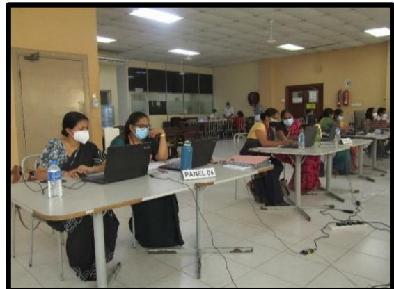
7වන බඳවා ගැනීම සඳහා මාර්ගගත සම්මුඛ පරීක්ෂණ පැවැත්වීම.