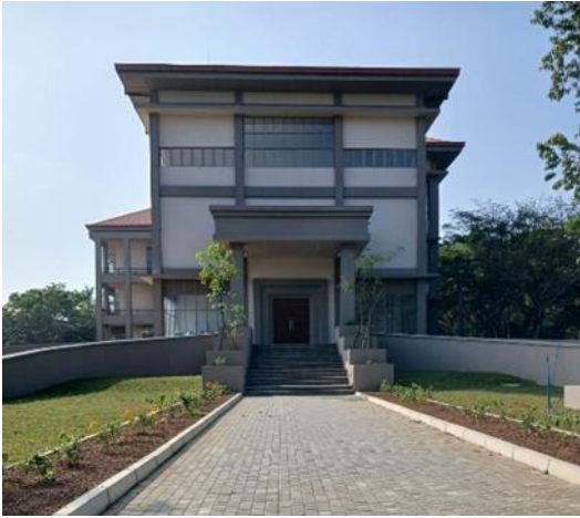
පුස්තකාල ගොඩනැගිල්ල, වයඹ විශ්වවිද්‍යාලය - කුලියාපිටිය පරිශ්‍රය